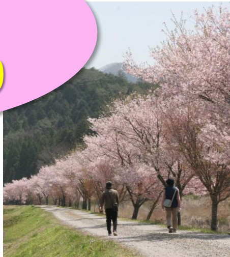
清水のコヒガンザクラ【設楽町】