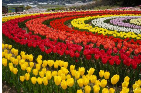
チューリップフェア【田原市・サンテパルクたはら】 3/16～4/中