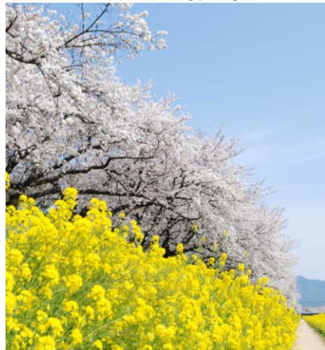
佐奈川堤のソメイヨシノと菜の花【豊川市】