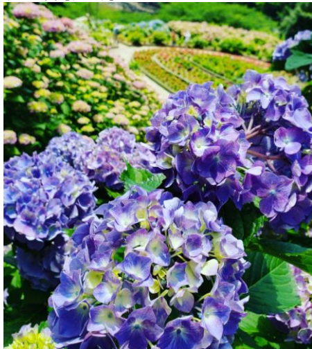
形原あじさいの里【蒲郡市】