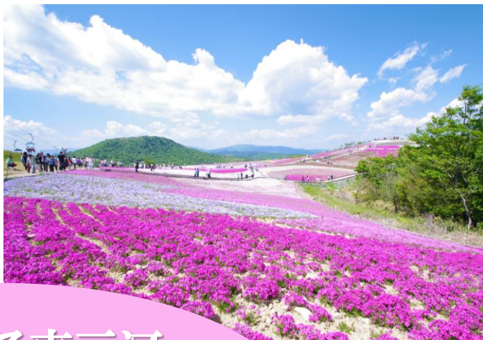
茶白山高原・芝桜の丘【豊根村】