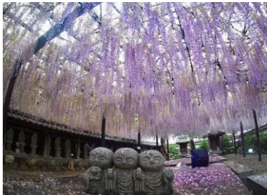
長藤【潮音寺・田原市】4/中～5/上