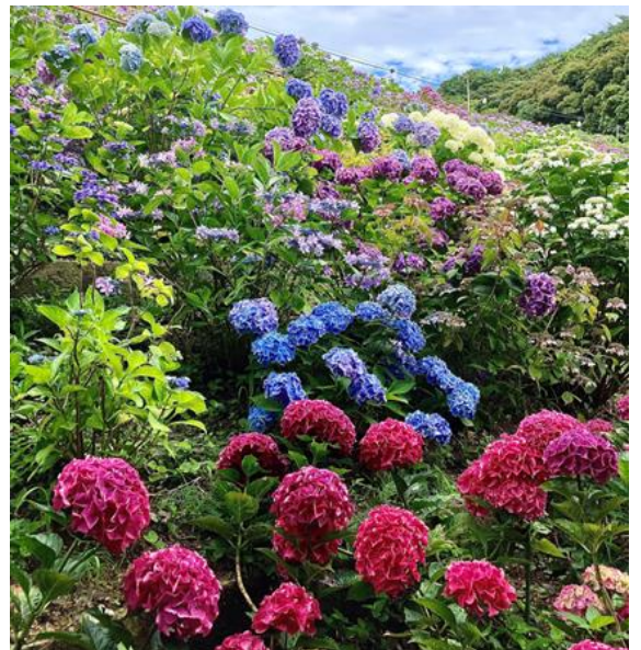
あじさい祭り【蒲郡市・形原温泉】6/1～6/30