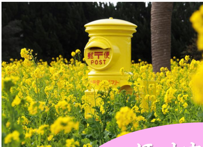
伊良湖菜の花ガーデン【田原市】