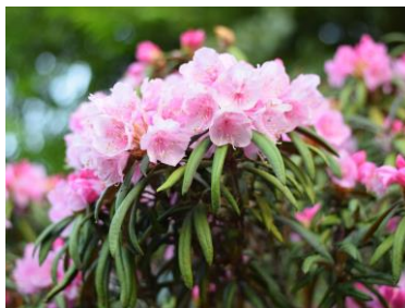
ホソバシャクナゲ【愛知県民の森・新城市】 4/末～5月