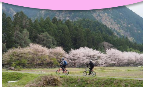
大千瀬川沿の桜【東栄町】