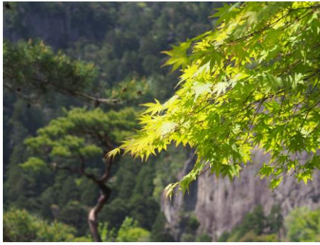
青もみじ【新城市・鳳来寺山】4/下～5/上