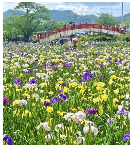
賀茂しょうぶ園【豊橋市】