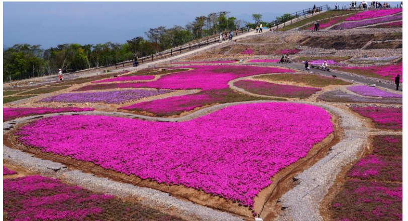
芝桜まつり【豊根村・茶臼山高原芝桜の丘】5/中～6/上