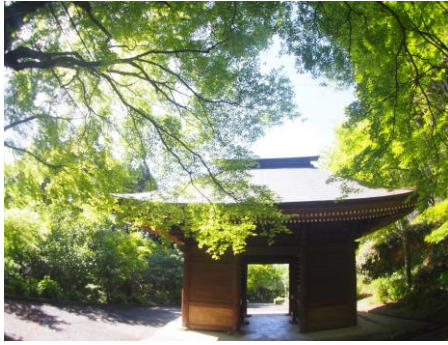
青もみじ【豊橋市・普門寺】4/中～5/中

春夏秋冬、四季を彩る美しい花模様が見られるのが東三河の魅力です。なかでも春は梅、桜、しょうぶ、あじさい、新緑、青もみじまで最もバラエティに富んだ季節です。海、山、川の自然とともに春の花めぐりをお楽しみください。