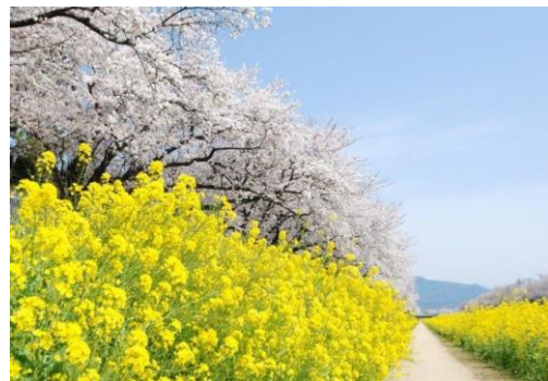
佐奈川堤のソメイヨシノと菜の花【豊川市】3/中～4/上