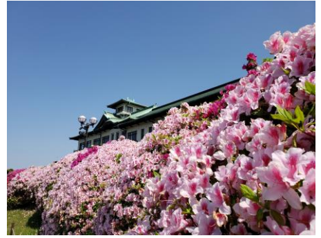
つつじまつり【蒲郡市・蒲郡クラシックホテル】4/下～5/上