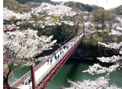
新城さくらまつり【新城市・桜淵公園】 3/20～4/4