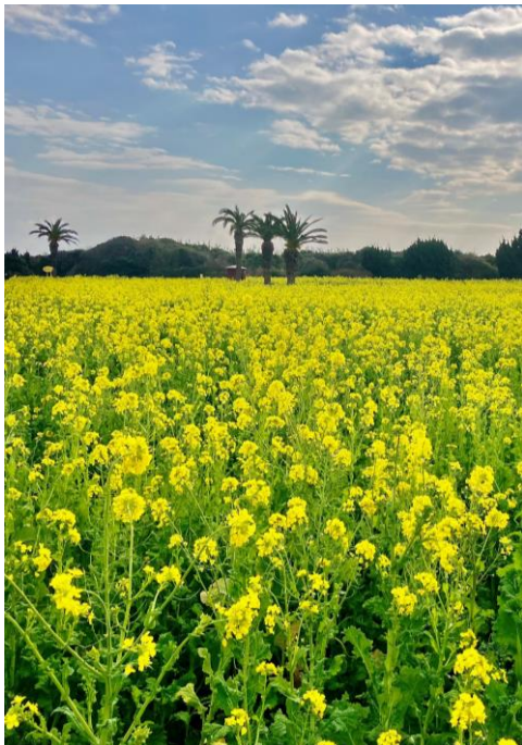
渥美半島菜の花まつり【田原市・伊良湖菜の花ガーデン他】 ～3/31