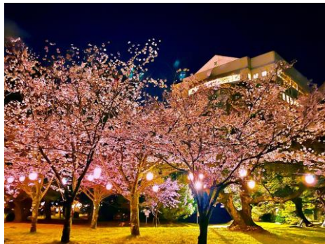
春まつり(さくら)【豊橋市・豊橋公園他】3/20～4/7