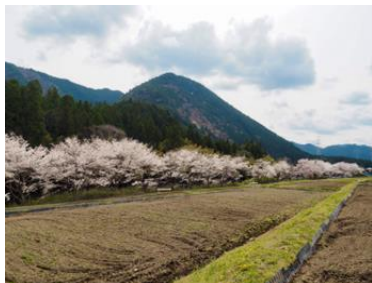
桜【大千瀬川沿・東栄町】4/上～4/中