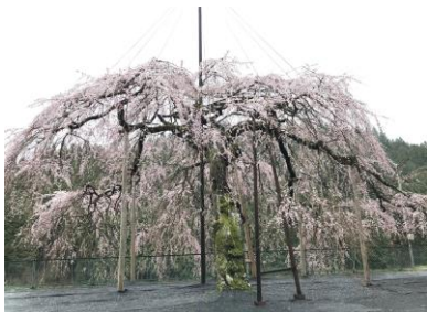
ウバヒガンザクラ【設楽町・八橋】4/上