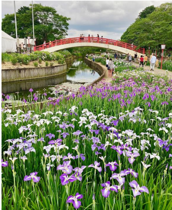
花しょうぶまつり【豊橋市・賀茂しょうぶ園】5/下～6/上