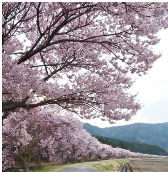
清水のコヒガンザクラ【設楽町・道の駅アグリステーションなぐら】 4/上