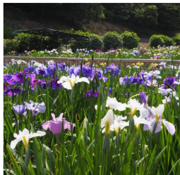
しょうぶ【田原市・初立池公園】5月～6月